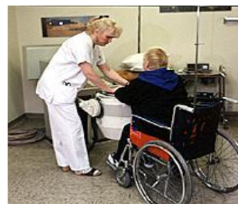
Structures médico-sociales destinées aux personnes en situation de handicap (adultes ou enfants)