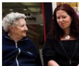
Structures médico-sociales accueillant des personnes âgées

Ecoles maternelles - Ecoles primaires auprès d'accompagnants du jeune en situation de handicap